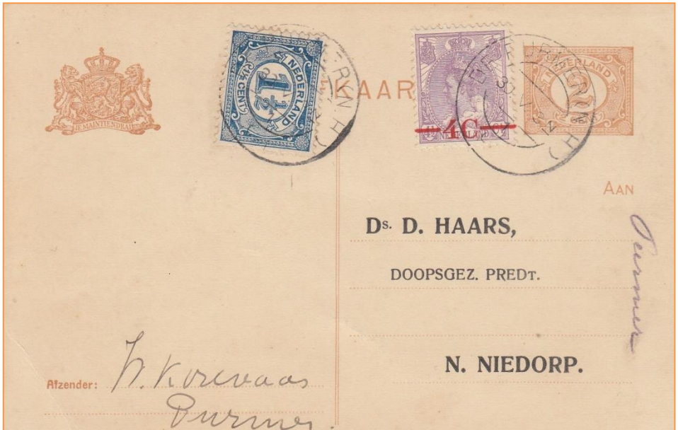
Typenraderstempel met korte balk van hulppostkantoor De Purmer (1921)