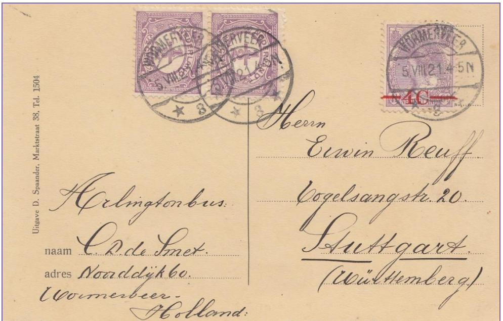
Ansichtkaart van Wormerveer naar Duitsland, drukwerktaarif van 5 cent, NVPH 50+106

Een variant op dit stempel is het zgn. Martin-stempel, dat slechts in een aantal plaatsen kort gebruikt is.